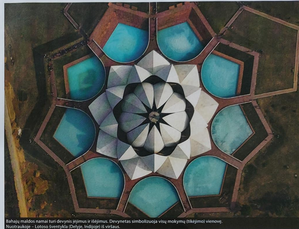
Bahajų maldos namai turi devynis įėjimus ir išėjimus. Devynetas simbolizuoja visų mokymų (tikėjimo) vienovę. Nuotraukoje – Lotoso šventykla (Delyje, Indijoje) iš viršaus.

nuostatų bahajai yra bendruomenei paaukoti 19 proc. nuo savo nebūtinųjų išlaidų. Aukojimas fondams yra savanoriškas veiksmas. Kiekvienam asmeniui paliekama galimybė nuspręsti, atžvelgiant į tai, kaip jis ar ji supranta su tuo susijusius principus, kiek jis gali prisidėti.