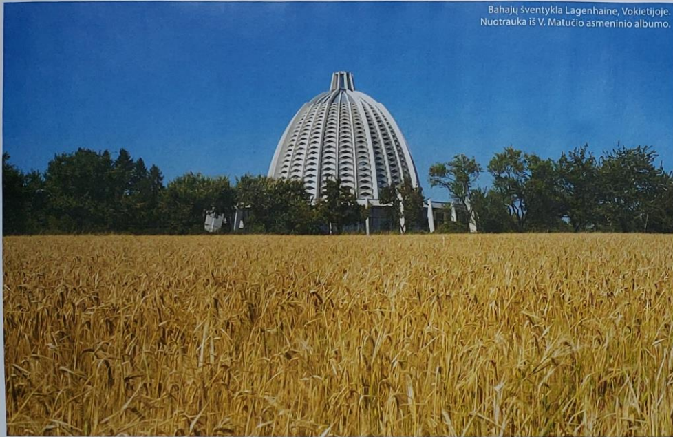
Bahajų šventykla Lagenhaine, Vokietijoje.

jūros, buvo kalbama viena kalba, skyrėsi tik tarmės. Tad tai galbūt būtų lietuvių, ypač senoji kalba, kuri gyva, turtinga, žodis buvo gyvas, save paaiškino ir, anot kai kurių, būtent iš mūsų senosios kalbos kilo sanskritas? Nebūtina.