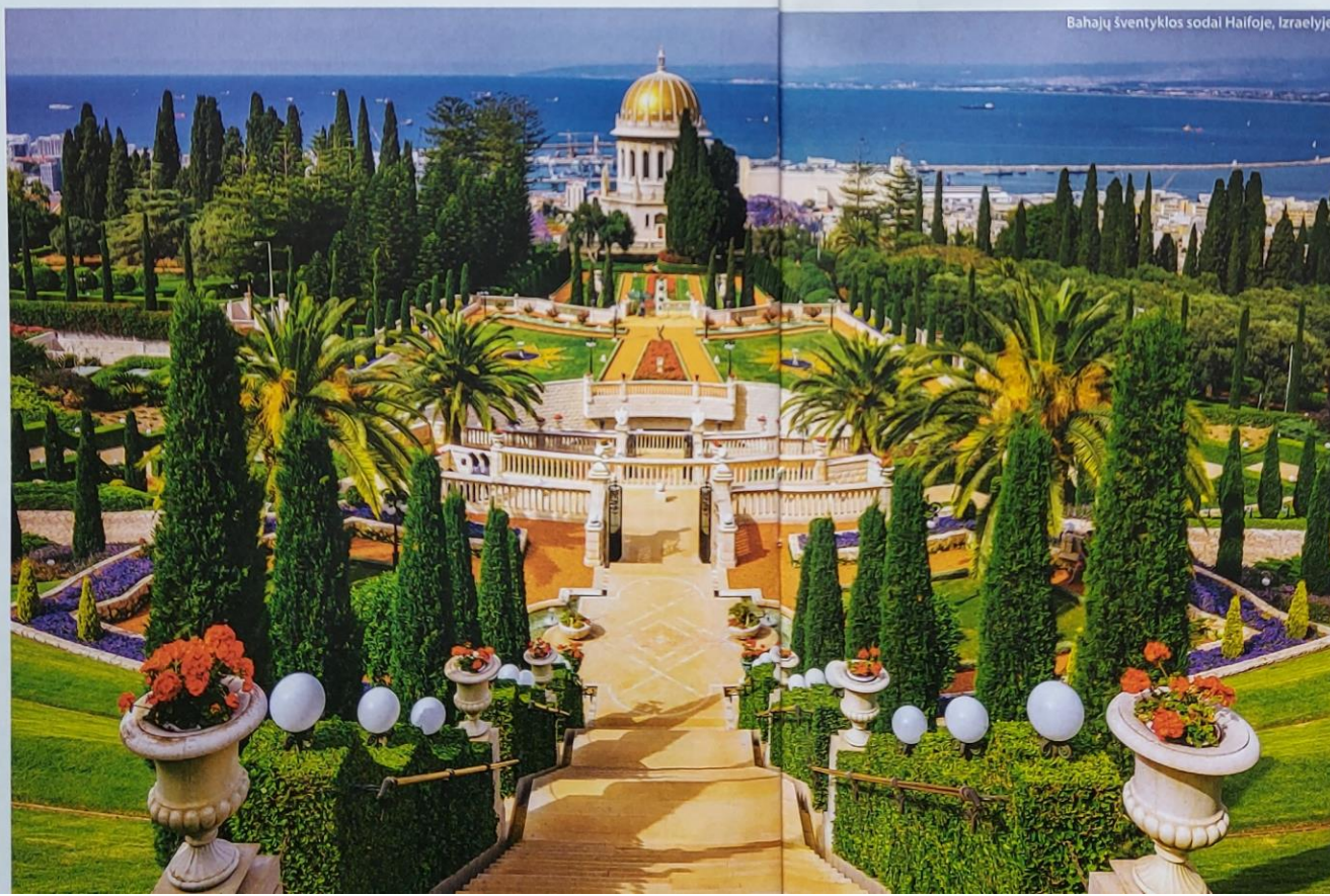
Bahajų šventyklos sodai Haifoje, Izraelyje.

Bet dar nuo Egipto laikų naudojamas piramidės principas? Esantys apačioje išlaiko piramidę, pinigai, valdžia visą laiką viršuje? Pas jus privaloma bendruomenei atiduoti 19 proc. savo nebūtinųjų išlaidų. Viena svarbiausių ▶